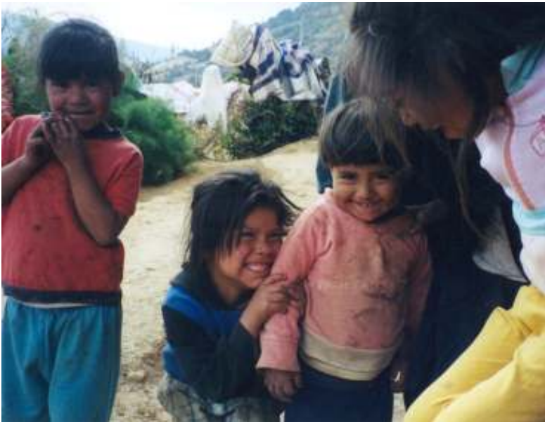
Disfrutando sus primos