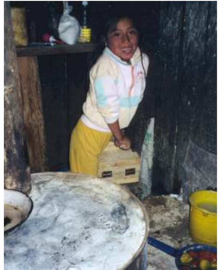
Orelia preparando las tortillas

Después ayudo a mi mamá con el desayuno. Generalmente comemos té y tortillas con frijoles. Me gusta tortillas! Puedo comer cinco por lo menos para desayuno, tres para el almuerzo y dos antes de ir a dormir. Cada día mi familia come 75 tortillas.