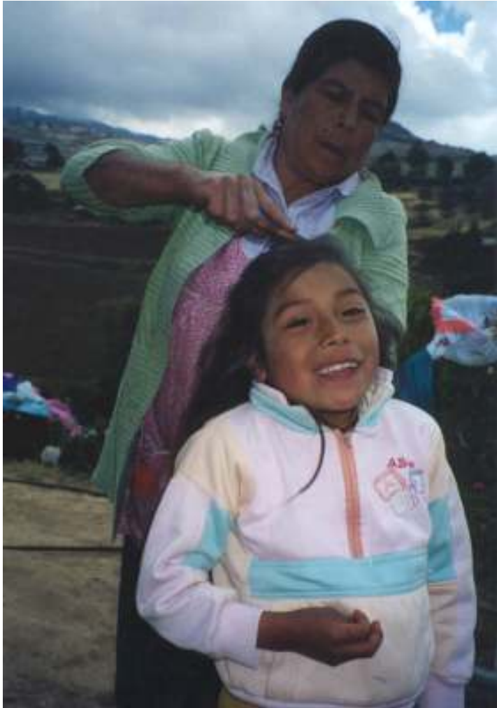
Su mamá hace trenzas en su pelo cada mañana.

Mi mamá es la primera persona que se levanta en la mañana. Me levanto después de ella y la primera cosa que hago es hacer mi cama.