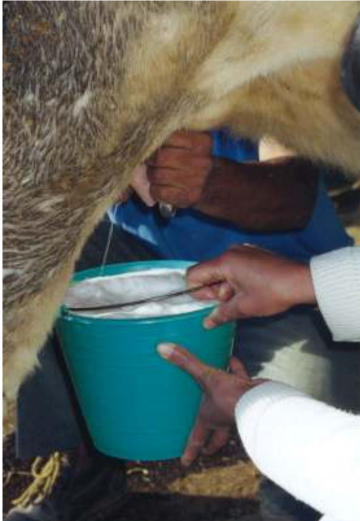
Ordeñando la vaca

Cada dos días mi mamá ordeña las vacas. No me gusta tomar leche. Después de comer, lavo los trastes con agua fría y me preparo para la escuela.